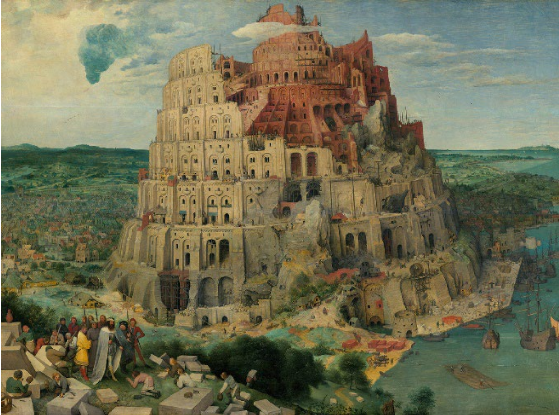
Die babylonische Verwirrung